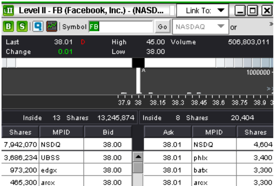
图 1 Facebook 报价图

之后根据公司公告也可以看到，承销商在第一天就全部用尽了稳定价格的额度，而接下来，由于主承销商隐瞒公司增长放缓等消息的传出，公司股价开始大幅下跌。但是，在这个过程中，Facebook 能够在第一天稳定住价格，超额配售选择权还是发挥了作用。