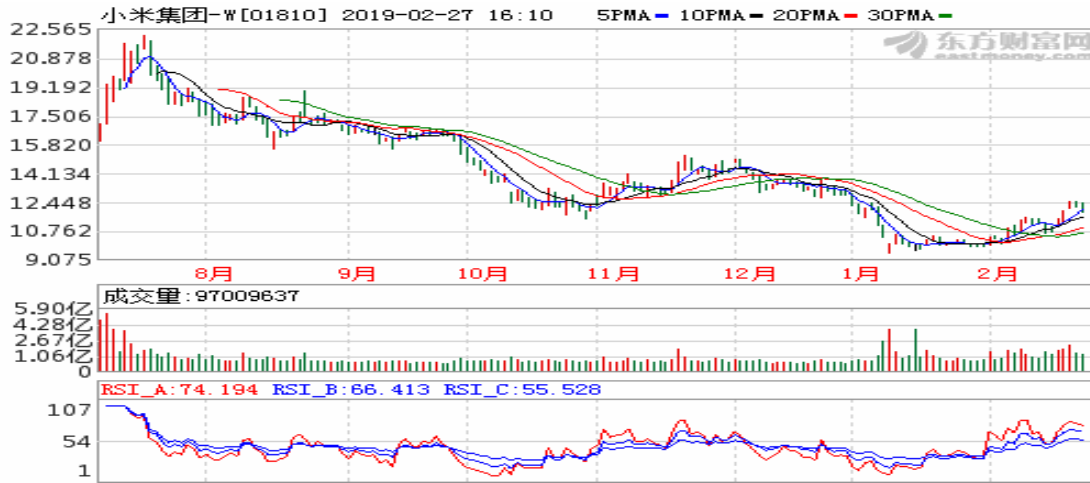
图 2 小米集团日线图

此外，同样2018年，于9月26日在香港IPO上市的著名火锅连锁集团海底捞，仅仅以超额认购4倍的市场热度，即以发行价格空间14.8-17.8港币的上限17.8港币发行。在发行过程中，海底捞公告称授予承销商高盛15%的超额配售选择权并允许其执行稳定价格。但是就在2018年8月20日海底捞正式登陆港股1个月之前，海底捞实际控制人张勇公开宣称，在IPO过程中将放弃使用超额配售选择权，同时宣称，如同小米集团一样，将自行组织资金进行稳定价格，这一举动曾经被财经媒体解读为增强投资人的投资信心。从下图可以看出，海底捞上市后在稳定价格期的30天内，股价走势十分平稳，每当出现下影线时，收盘价格仍旧均可以收在发行价格17.8港币左右。最终，根据公告，承销商高盛以最低16港币，最高17.8港币的价格从市场买入超额配售的15%用以归还借入的股票，超额配售选择权未行权而失效。稳定价格期接受之后，海底捞的价格也是在逐步攀升的过程中。从海底捞使用超额配售选择权的过程中我们可以看到，首先为了更高的发行价格，发行人可能在承销商的说服下接受使用超额配售选择权，而获得了在更高发行价格发行更多股份融回更多资金的可能；其次，承销商在获得超额配售选择权及其授予的稳定价