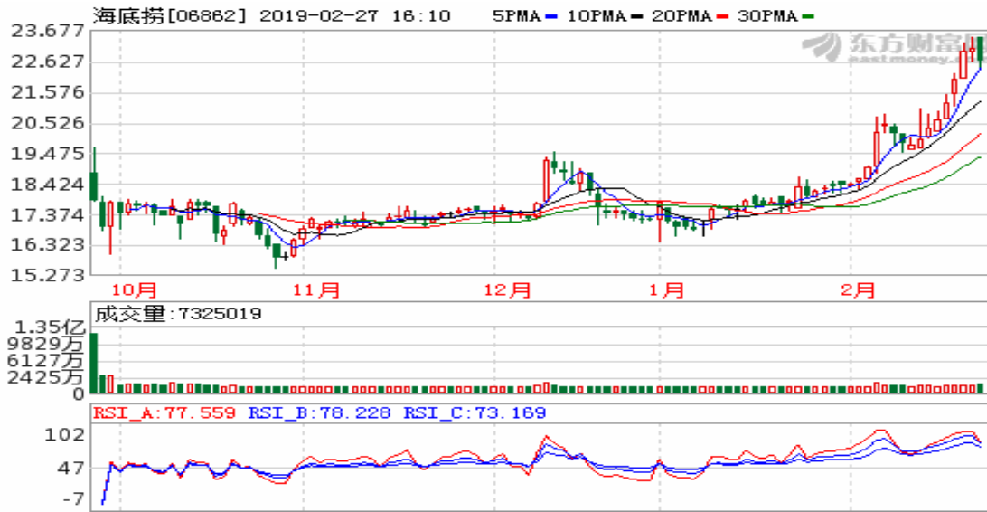
图 3 海底捞日线图

从以上 2 个案例我们不难看出，超额配售选择权是在 IPO 过程中十分重要的关键因素，其既可能影响 IPO 定价，也可能影响 IPO 上后的交易价格，既能影响发行人的收益，也对承销商的收益起到关键作用，同时还会影响到投资人的收益。香港 IPO 市场自 1994 年年引入超额配售选择权，并由于 2003 年 4 月正式开始施行的香港《证券及期货(稳定价格)规则》第三部分第 6 条进行法律规管。基本稳定价格行动规定：超额配售选择权作为法律认可的稳价方式，只可进行向上稳定价格的行为。同时，规则规定，向上稳定价格的超额配售选择权通常要不能在公众认可的合理价格空间以下进行，通常，只有 IPO 发行时的市盈率达到 10 倍（含）以上，获市净率达到 1: 1 以上，才允许包含超额配售选择权发行。